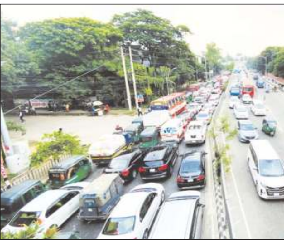
রাজধানীর তেজগাঁওয়ে সাতরাঙা এলাকায় তীব্র যানজট। ছবিটি বুধবার তোলা