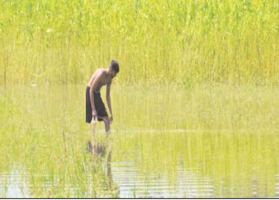
জমিতে বৃষ্টির পানি জমেছে। জাল ফেলে মাছ ধরছে এলাকাবাসী। ছবিটি বুধবার রাজশাহীর পবা উপজেলা থেকে তোলা।