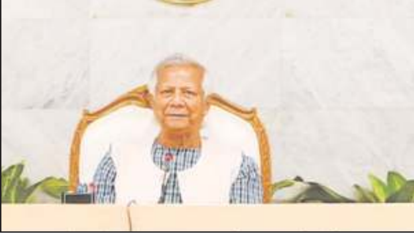
প্রধান উপদেষ্টা ড. মুহাম্মদ ইউনুস বুধবার তাঁর কার্যালয়ে একনেক সভায় সভাপতিত্ব করেন।

স্টাফ রিপোর্টার : অন্তর্ভুক্তি সরকারের প্রধান উপদেষ্টা অধ্যাপক ড. মুহাম্মদ ইউনুস বলেছেন, রাজনৈতিক উদ্দেশ্যে নেওয়া প্রকল্প পুনর্বিবেচনা করা হবে। এখন বন্যায় ক্ষতিগ্রস্ত এলাকায় বেশি নজর দিতে হবে। আওয়ামী লীগ সরকারের পতনের পর প্রথম অনুষ্ঠিত জাতীয় অর্থনৈতিক পরিষদের নির্বাহী কমিটির (একনেক) সভায় তিনি এ কথা বলেন। গতকাল বুধবার প্রথমবারের মতো তেজগাঁওয়ে প্রধান উপদেষ্টার সভাপতিত্বে তার কার্যালয়ে এ সভা অনুষ্ঠিত হয়। সভায় প্রধান উপদেষ্টা বলেন, এখন থেকে প্রকল্পের সব তথ্য ওপেন থাকবে। মেগা প্রকল্প না নিয়ে জনগুরুত্বপূর্ণ ছোট প্রকল্প নেওয়ার বিষয়ে উপদেষ্টামণ্ডলীর সদস্যরা এক হন। ড. মুহাম্মদ ইউনুস আরও বলেন, রাজনৈতিক উদ্দেশ্যে নেওয়া প্রকল্পে চিন্তা দরকার। মেগা প্রকল্পও বাদ দিতে হবে। নিরপেক্ষ ও স্বাধীনভাবে কাজ করতে হবে। প্রকল্প প্রণয়ন ও বাস্তবায়ন নিয়ে কাজ করতে হবে। প্রকল্পের সবকিছু ওপেন থাকবে। শুধু পিডি জানাবে তা নয়, সবাই জানবে। সামনে বড় প্রকল্প নয়, জনগুরুত্বপূর্ণ ছোট প্রকল্প নেওয়া হবে।