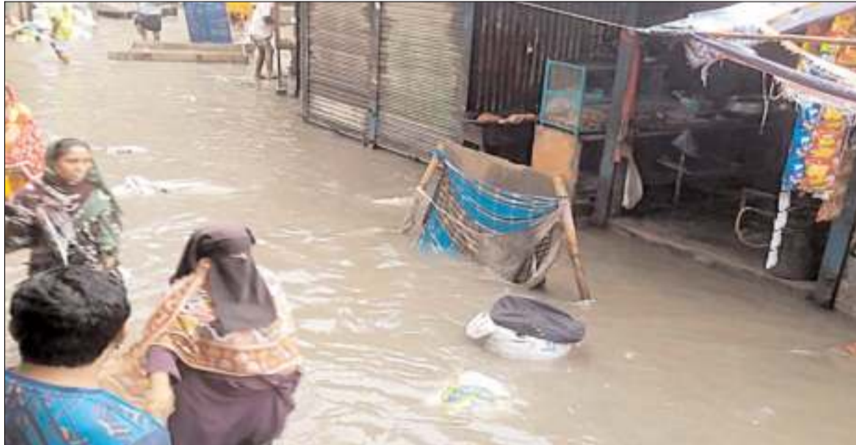
শনিবার রাজধানীর খিলগাঁও শিপাহীবাগ মধ্যপাড়া এলাকায় বৃষ্টির পানিতে ডুবে আছে সড়ক পথ মানুষের চরম ভোগান্তি।