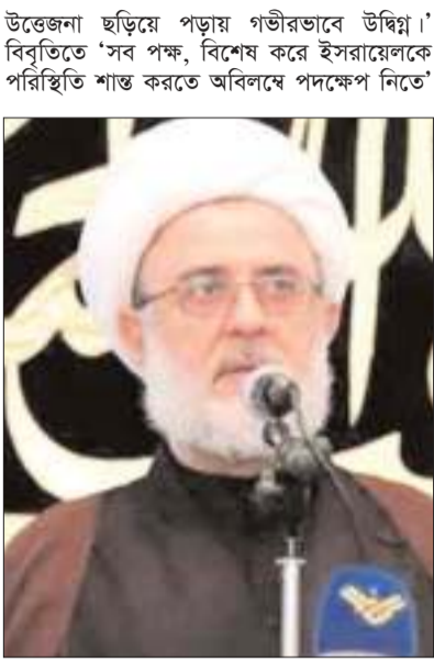
আহ্বান জানিয়েছে চীন। জাতিসংঘের নিরাপত্তা কাউন্সিলকে বৈঠকে আহ্বান ইরানের; নাসরায়াহর মৃত্যুর ঘটনাকে কেন্দ্র করে জাতিসংঘের নিরাপত্তা পরিষদের

বিস্তৃতিতে বলা হয়েছে, 'চীন পরিস্থিতি নিবি-ডুভাবে পর্যবেক্ষণ করছে এবং অঞ্চলটিতে