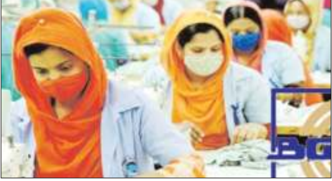
নিনারপত্রায় সেনাবাহিনীর নেতৃত্বে যৌথবাহিনী গঠন হয়েছে এবং যৌথবাহিনী গার্মেন্টস অধ্যুষিত অঞ্চলগুলোর নিরাপত্তা নিশ্চিত রিয়ামিতদের টহল পরিচালনা করেছে। বিজিএমইএ সেনাবাহিনী নীর সহযোগিতায় কমিউনিটি পুলিশিং চালু করেছে। তিনি বলেন, পোশাক কারখানাগুলোতে

তাছাড়া বিজিএমইএ এর অনুরোধের প্রেক্ষিতে বাংলাদেশ ব্যাংক আগস্ট মাসের বেতনভাতা পরিশোধের জন্য ব্যাংকগুলোকে নির্দেশনা দিয়েছে। বিজিএমইএ সভাপতি বলেন, শ্রম অসন্তোষে আঞ্চলিকায় ক্ষতিগ্রস্ত ৩৯টি পোশাক কারখানার শ্রমিকদের সেন্টেম্বর মাসের বেতনভাতা পরিশোধের সক্ষমতা ছিল না। বিজিএমইএ থেকে অর্থ মন্ত্রণালয়কে সেন্টেম্বর মাসের বেতনভাতা পরিশোধের লক্ষ্যে ৩৯টি পোশাক কারখানাকে সুদবিহীন সহজ শর্তে ঋণ দেওয়ার ব্যবস্থা গ্রহণের জন্য অনুরোধ করা হয়েছে। এ সময় বোর্ডের অন্যান্য নেতৃবৃন্দ এবং সদস্যরাও উপস্থিত ছিলেন।