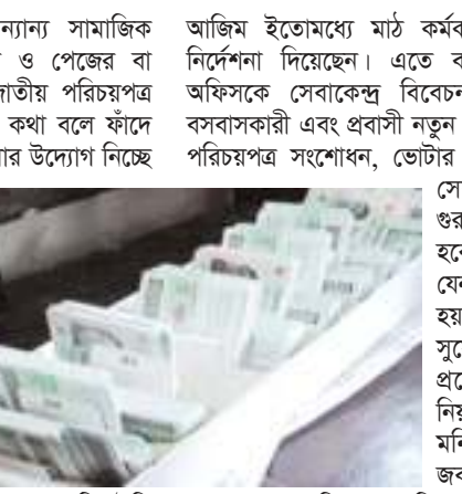
৭-এর পাতায় দেখুন

স্টাফ রিপোর্টার : ফেসবুকসহ অন্যান্য সামাজিক যোগাযোগমাধ্যমে চক্রাদার বিজ্ঞাপন ও পোস্তের বা গ্রুপের মাধ্যমে সাধারণ মানুষের জাতীয় পরিচয়পত্র (এনআইডি) সংশোধন করে দেওয়ার কথা বলে ফৌদে ফেলেছে একটি চক্র। এদের ধরতে এবার উদ্যোগ নিচ্ছে নির্বাচন কমিশন (ইসি)। জানা গেছে, আগেও বিষয়টি ইসির নজরে এসেছে। ক্ষেত্র বিশেষে গ্রুপ, পেজ ও প্রোফাইলগুলো চিহ্নিত করে তা বিটিআরসি'র মাধ্যমে বন্ধ করে দেওয়া হয়েছে। কিন্তু কারও বিরুদ্ধে আইনগত কোনো ব্যবস্থা নেওয়া হয়নি। তবে এবার সেন্দিক যোগে সংস্কার। ইসি কর্মকর্তারা বলেন, গ্রুপ, পেজ বা প্রোফাইল বন্ধ করে দিলে নতুন করে আবার খোলা হয়। এতে আসলে ভেমন কাজ হয় না। তাই মামলা দেওয়ার চিন্তা-ভাবনা করা হয়েছে। এছাড়া সশরীরে অনেক দালাল চক্র নির্বাচন ভবনের আশপাশে ঘোরাফেরা করে। তাদেরও ধরে পুলিশের দেওয়ার সিদ্ধান্ত হয়েছে। এনআইডি শাখার এক উপ-পরিচালক এ বিষয়ে বলেন, দালাল চক্রকে ধরার জন্য আমাদের লোকলভ উৎপেতে রয়েছে। এদের ছাড় দেওয়া হবে না। এ নিয়ে ইসি সচিব শফিকুল