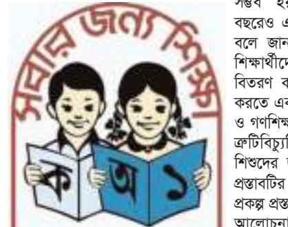
৭-এর পাতায় দেখুন

স্টাফ রিপোর্টার : প্রাথমিক বিদ্যালয়ের শিক্ষার্থীদের পুষ্টি নিশ্চিত করা ও খারে পড়া চেকাতে স্কুল ফিডিং কর্মসূচি চালু করার উদ্যোগ নিয়োজিত সরকার। শিশুদের মাঝে খাদ্যসামগ্রী বিতরণের উদ্দেশ্যে কর্মসূচি গত বছরের অক্টোবরে চালু হওয়ার কথা ছিল। কিন্তু বছর পেরিয়ে গেলেও তা চালু করা সম্ভব হয়নি। এমনকি চলতি বছরেও এটা চালু করা সম্ভব নয় বলে জানা গেছে। জানা গেছে, শিক্ষার্থীদের মাঝে খাদ্যসামগ্রী বিতরণ কর্মসূচি নতুন করে চালু করতে একটি প্রকল্প নেয় প্রাথমিক ও গণশিক্ষা মন্ত্রণালয়। কিন্তু নানা ক্রটিবিত্যুতি থাকার কারণে শিশুদের জন্য জরুরি এই প্রকল্প প্রবর্তার অনুমোদন মিলছে না। প্রকল্প প্রস্তাব নিয়ে একের পর এক আলোচনা-পর্যালোচনা আর সংশোধন চলছে। মূলত আলোচনা, মূল্যায়ন আর সংশোধনে আটকে আছে প্রকল্পের অনুমোদন। সংশ্লিষ্ট সূত্রে জানা গেছে, ২০২৩ সালে 'সরকারি স্কুল ফিডিং কর্মসূচি-১' শীর্ষক একটি প্রকল্প প্রস্তাব করে প্রাথমিক ও গণশিক্ষা মন্ত্রণালয়। প্রকল্প বাস্তবায়নে খরচ হবে ৪ হাজার ৫০১ কোটি টাকা। যদিও প্রাথমিক ও গণশিক্ষা মন্ত্রণালয় ৪ হাজার ৭৫৯ কোটি টাকা ধরা হয়েছিল; কিন্তু পরিকল্পনা কমিশনের নির্দেশনা অনুযায়ী ব্যয় ২২৮ কোটি টাকা কমানো হয়। প্রকল্পটি অনুমোদন পেলে তিন বছর মেয়াদে বাস্তবায়ন করবে প্রাথমিক শিক্ষা অধিদপ্তর। প্রকল্পের উদ্দেশ্য সম্পর্কে বলা হয়েছে, প্রাথমিক বিদ্যালয়ের শিক্ষার্থীদের বিদ্যালয়ে ভর্তি এবং উপস্থিত হার