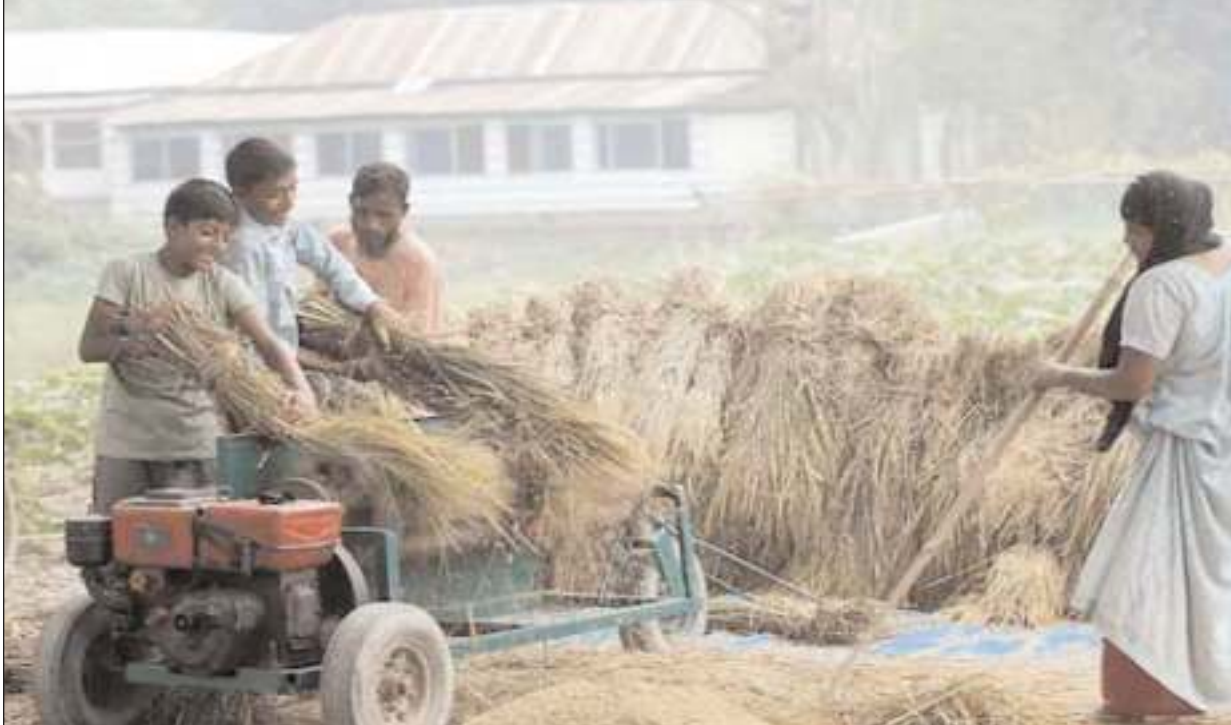
আউশ ধান মড়াইয়ে ব্যস্ত কৃষকেরা। পোসাইবাড়ী, সোনাতলা, বণ্ডা