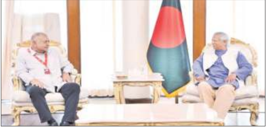
প্রধান উপদেষ্টা প্রফেসর মুহাম্মদ ইউনূস ঢাকায় রাষ্ট্রীয় অতিথি ভবনে যমুনায় গণফোরামের নেতৃবৃন্দের সাথে সংলাপে অংশ নেন।

স্টাফ রিপোর্টার : রাজনৈতিক দলগুলোর সঙ্গে আবারও সংলাপ শুরু করেছেন অন্তর্ভুক্তি সরকারের প্রধান উপদেষ্টা ড. মুহাম্মদ ইউনূস। শনিবার (১৯ অক্টোবর) বিকেল ৩টায় এই সংলাপ শুরু হয়েছে।