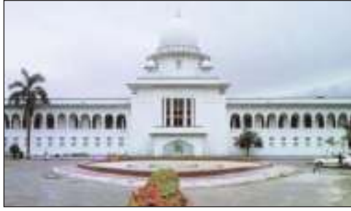
২-এর পাতায় দেখুন