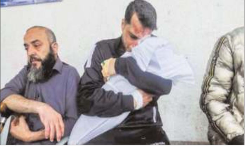
আন্তর্জাতিক ডেস্ক : একদিনেই গাজায় শতাধিক ফিলিস্তিনিকে হত্যা করেছে ইসরায়েল। অবরুদ্ধ এই উপত্যকায় কমপক্ষে ১১১ জন ফিলিস্তিনি নিহত হয়েছে। বেশ কিছু মেডিক্যাল স্ত্রী এ তথ্য নিশ্চিত করেছে। এদিকে গাজায় গৃহযুদ্ধের গণহত্যার অভিযোগ তদন্তের আহ্বান জানিয়েছেন

পোপ ফ্রান্সিস। বর আল জাজিরার। গত ৭ অক্টোবর ইসরায়েলে আকস্মিক হামলা চালায় ফিলিস্তিনি স্বাধীনতাকামী সংগঠন হামাস। এরপরই গাজায় পাক্টা আক্রমণ চালায় ইসরায়েল। এক বছরের বেশি সময় ধরে গাজায় আগ্রাসন চালাচ্ছে দখলদার বাহিনী। এখন পর্যন্ত