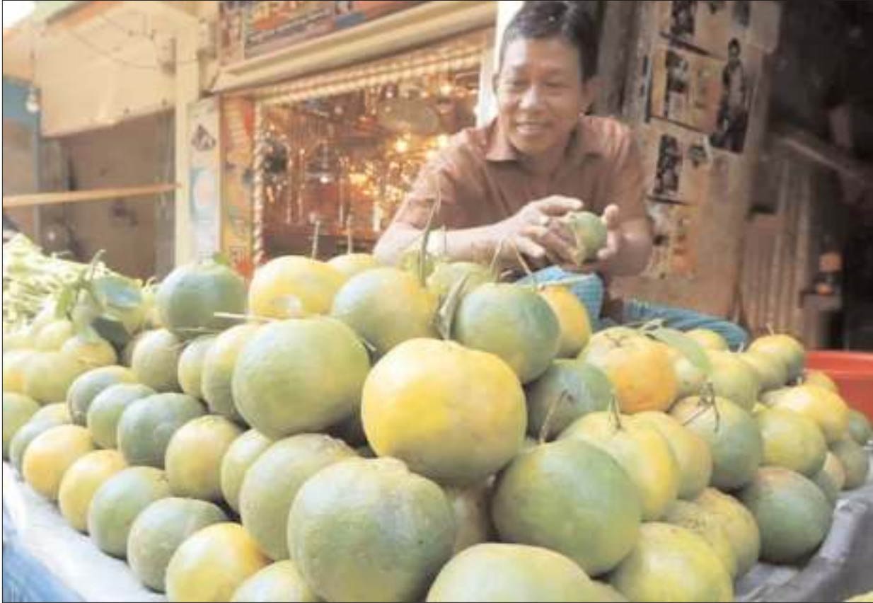
গাছে পাকা পাছাড়ি কমলা বাগানির কাছ থেকে কিনে বিক্রির জন্য সাজিয়ে রেখেছেন স্থানীয় ব্যবসায়ী। দেওয়ান পাড়া, রাঙামাটি,