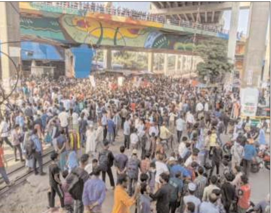
রাজধানীর সরকারি তিতুমীর কলেজকে বিশ্ববিদ্যালয় করার দাবিতে মহাখালীতে সড়ক ও রেলপথ অবরোধ করে শিক্ষার্থীরা।

স্টাফ রিপোর্টার : নারায়ণগঞ্জের সোনারগাঁয়ে মেঘনা গ্রুপের টিস্যু কারখানায় লাগা অগ্নিকাণ্ডের ঘটনা ঘটেছে। তবে এই ঘটনায় কেউ হতাহত হয়নি। গতকাল সোমবার সকাল ৯টার দিকে আগুন নিয়ন্ত্রণে আসে। ফায়ার সার্ভিসের ১৪টি ইউনিট আগুন নিয়ন্ত্রণে কাজ করে। এর আগে, ভোর সোয়া ৪টায় উপজেলার বাউচর এলাকার মেঘনা গ্রুপের টিস্যু কারখানায় অগ্নিকাণ্ডের ঘটনা ঘটে। ফায়ার সার্ভিস সূত্রে জানা গেছে, স্থানীয় ফায়ার সার্ভিস এবং মেঘনা গ্রুপের নিজস্ব ফায়ার সার্ভিসসহ ১৪টি ইউনিট আগুন নিয়ন্ত্রণে কাজ করে। টিস্যু কারখানায় আগুন লাগার ফলে মুহূর্তের মধ্যে চারদিকে ছড়িয়ে পড়ে। নিয়ন্ত্রণে আনতে অনেকটাই বেগ পেতে হয়েছে। নিয়ন্ত্রণে এলেও পুরোপুরি নিভে যায়নি। বিষয়টি নিশ্চিত করে ফায়ার সার্ভিসের মিডিয়া সেলের দায়িত্বে থাকা সিনিয়র স্টেশন অফিসার এ ২-এর পাতায় দেখুন