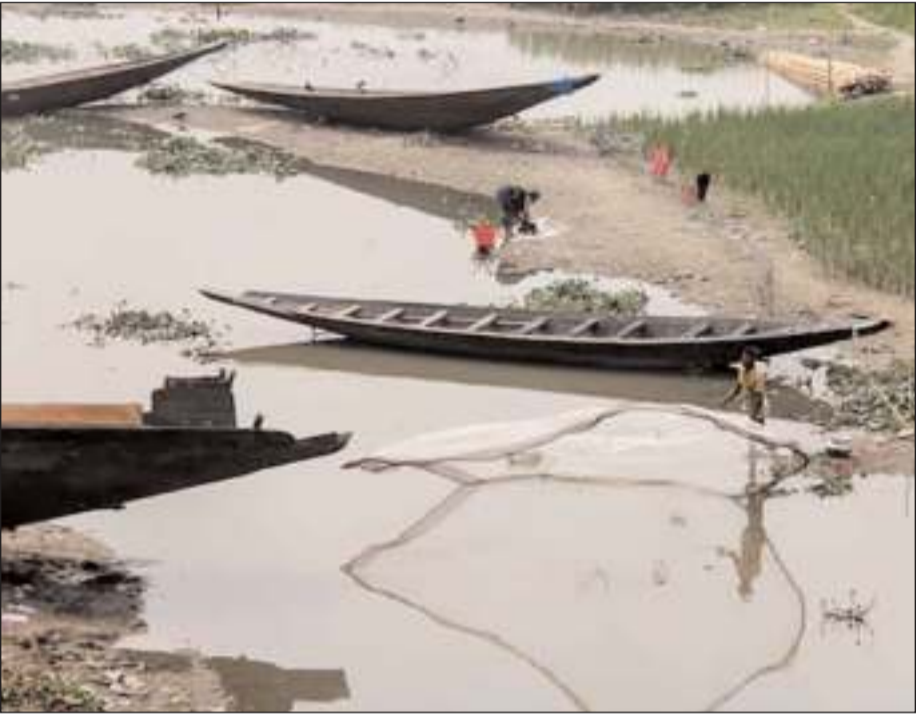
শুক মৌসুমে বুধির অভাবে পানি শুকিয়ে স়ক হয়ে গেছে নদী। অল্প পানিতে জাগ ফেলে মাছ ধরছেন এক মৎস্যজীবী। নিকলী, কিশোরগঞ্জ,