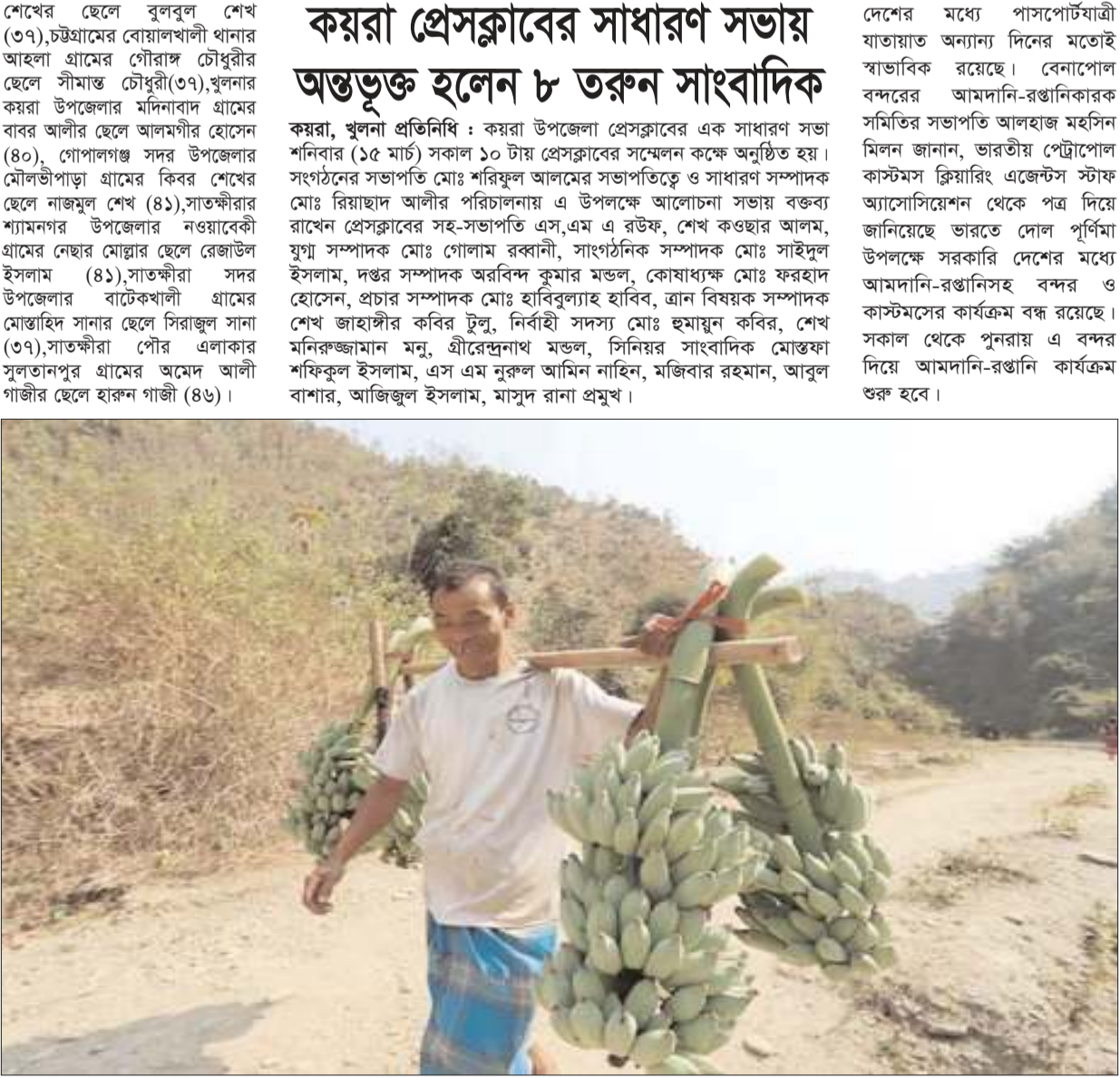
বিক্রির জন্য নিজের বাগানের কলার কাঁদি ডারে খুলিয়ে সাণ্ডার্কি হাটে নিয়ে যাচ্ছেন একজন পাহাড়ি ভ্রমচাষি। পবিত্র রমজান মাসে কলার চািহিা বেশি থাকায় শহর থেকে আসা পাইকারেরা হাট থেকে কলা কিনে নিয়ে যান। দেবতাহাড়ি মধ্যপাড়া, কাগ্তাই, রাজমাটি।