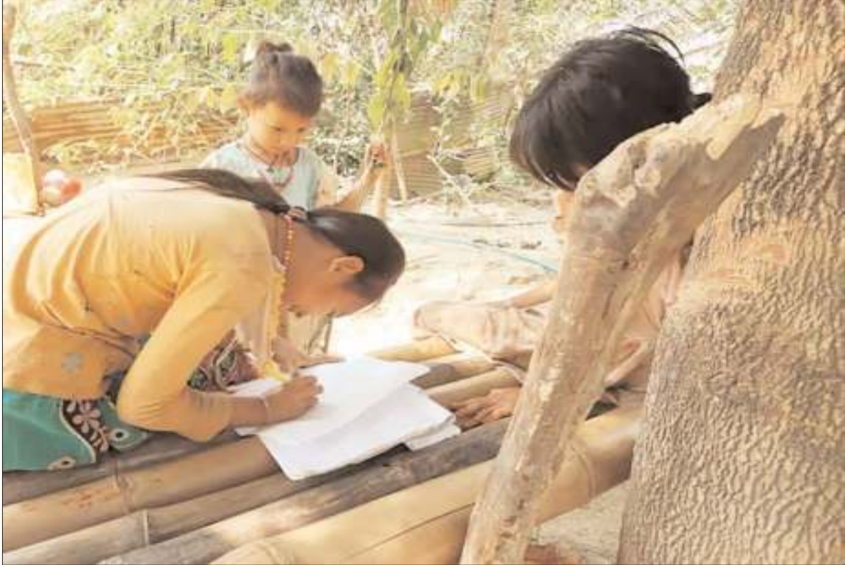
বাড়ির আঙিনায় গাছের নিচে পাতা মাচায় বসে লেখাপড়ায় ব্যস্ত কয়েকটি শিশু । দেবতাহাড়ি মধ্যপাড়া, কাগ্তাই, রাজমাটি ।